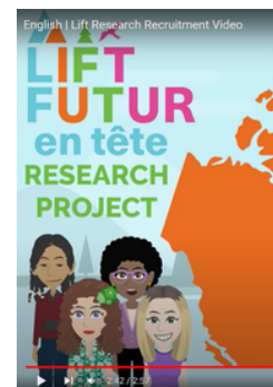
Vidéo promotionnelle de Lift/Futur en tête créée par le CJE